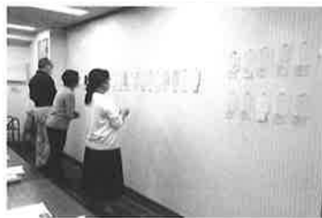
▲前回展の審査の様子